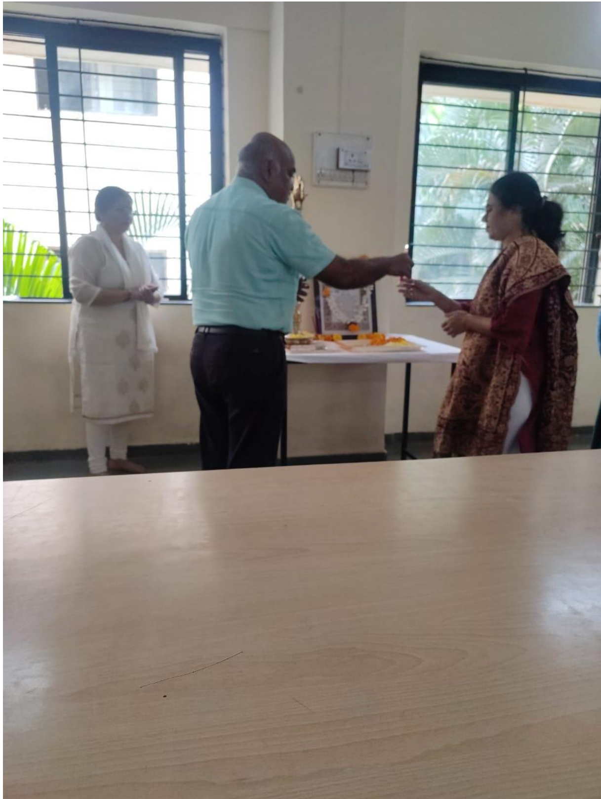
Glimpses of the Constitution Day Celebration: